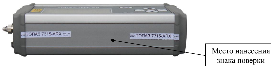
Рисунок 2 - Схема пломбировки тестеров от несанкционированного доступа, обозначение места нанесения знака поверки

Элементы настройки измерительной части тестеров конструктивно защищены. Корпус тестера опломбирован снаружи сбоку пломбой в виде наклейки, которая имеет разрушаемый слой, и при попытке несанкционированного вскрытия повреждается. Схема пломбировки тестеров от несанкционированного доступа, обозначение места нанесения знака поверки приведены на рисунке 2.